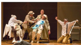
Commedia di Franco De Maestri premiata al primo concorso "Oggi in Veneto - Premio Nina Scapinello" Regia di BARBARA RIEBOLGE